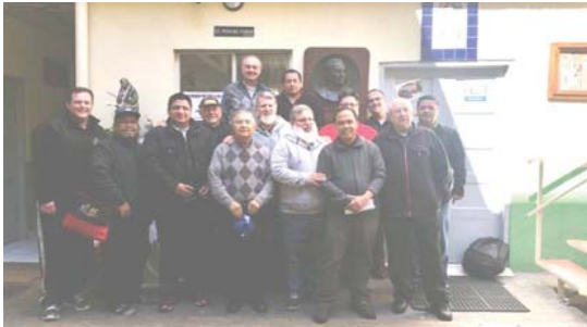
Scalabrinian Area Meeting (Calimex), last March 7- 9, 2016, attended by the local community of San Jose Los Angeles, Sun Valley and Tijuana.